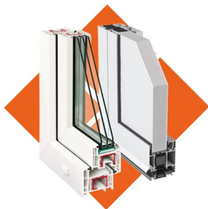
Хуванцар цонх, хаалга