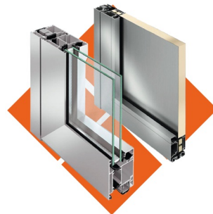
Хөнгөн цагаан цонх, хаалга, фасад