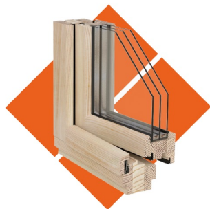
Модон цонх, хаалга